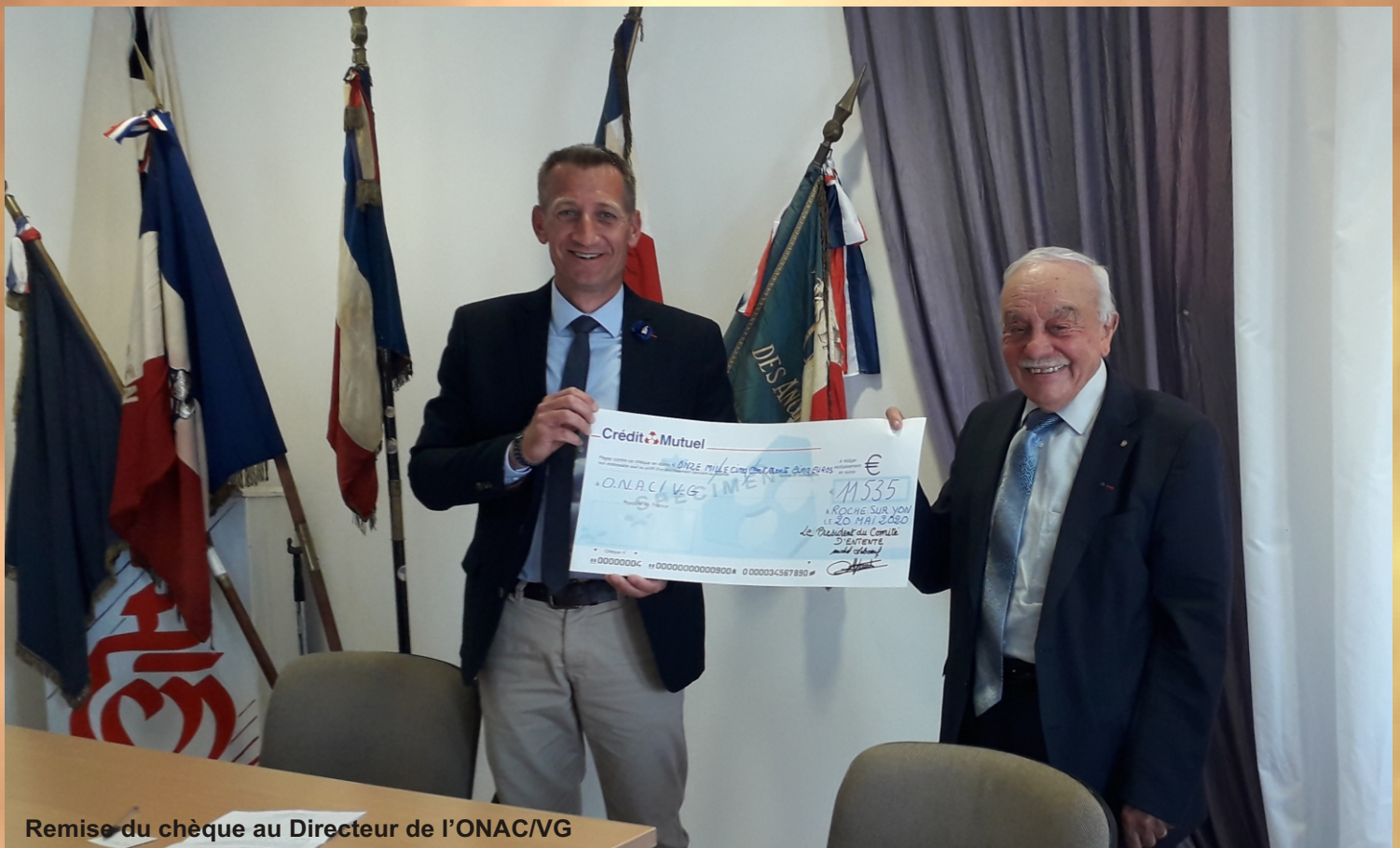
Remise du chèque au Directeur de l'ONAC/VG