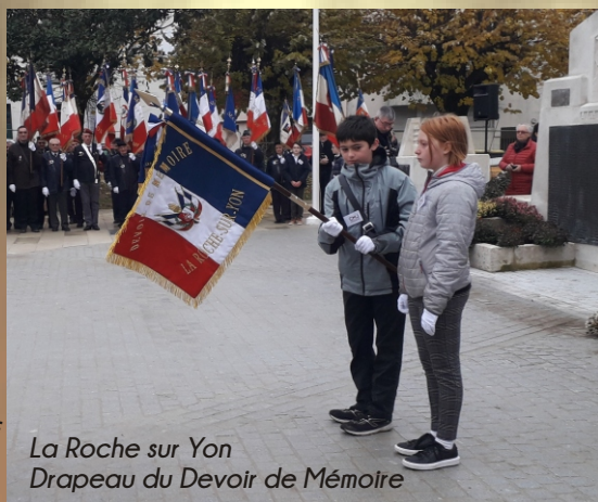
La Roche sur Yon Drapeau du Devoir de Mémoire

Avec les remises à Bournezeau et à la Roche sur Yon, nous comptons désormais 32 drapeaux du "Devoir de Mémoire". C'est une spécificité bien vendéenne, dont nous sommes fiers. Ils sont confiés à des écoles, des conseils municipaux des jeunes, des centres d'accueil et de loisirs... C'est important pour pouvoir pérenniser notre action mémorielle et préparer l'avenir. Néanmoins ces actions doivent être précédées d'un travail d'histoire et de mémoire avec les jeunes.