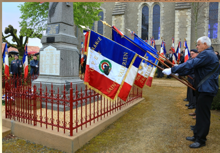
Remise de drapeau à Saint-Valérien