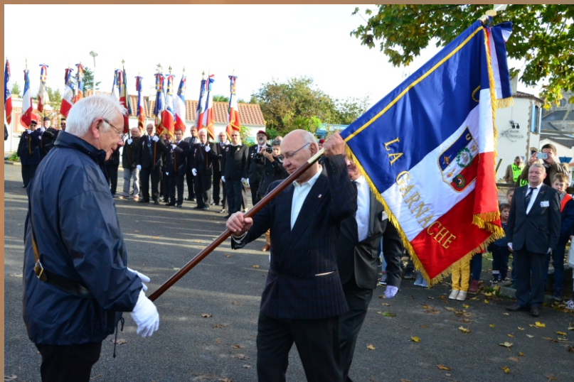
Remise de drapeau à la Garnache