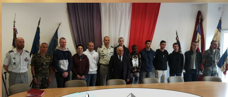
Visite du CIRFA

Dans le cadre du lien armées-nation, la maison du Combattant a accueilli le Centre d'Information et de Recrutement des Forces Armées (CIRFA) de la Roche. Des jeunes Vendéens qui ont choisi le métier des armes y ont signé leur contrat d'engagement. Cela a été pour eux l'occasion d'échanger avec le monde combattant.