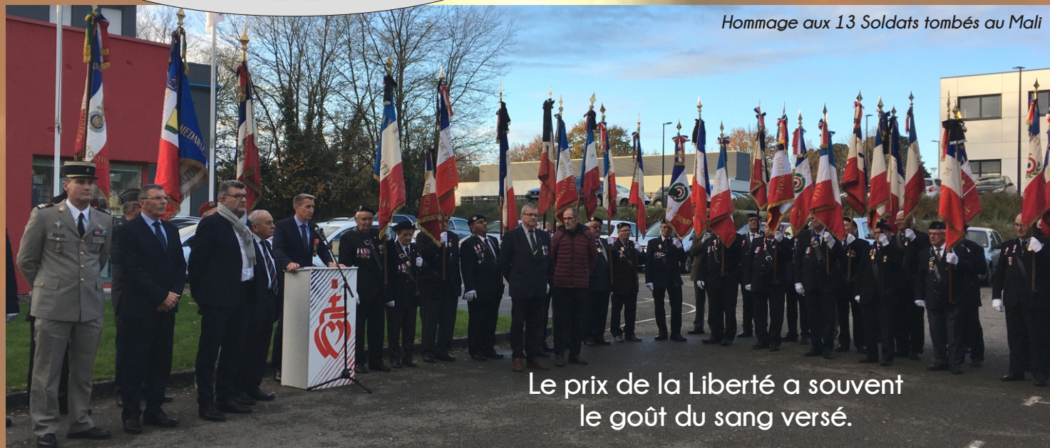
Hommage aux 13 Soldats tombés au Mali

Le prix de la Liberté a souvent le goût du sang versé.